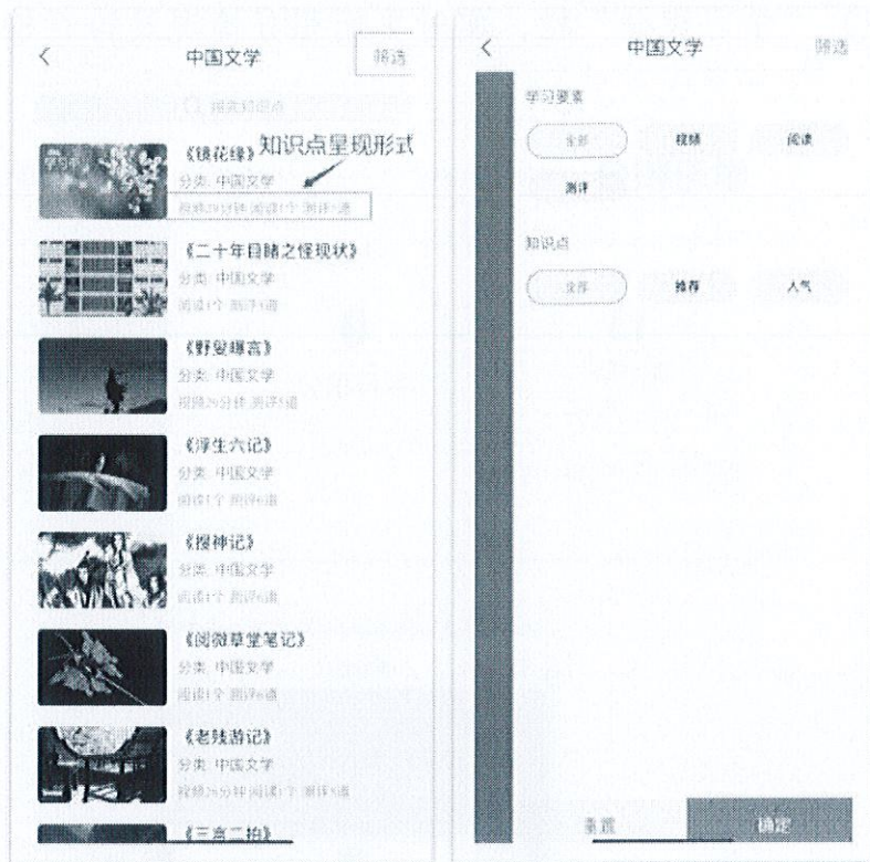
查看或筛选知识点呈现形式